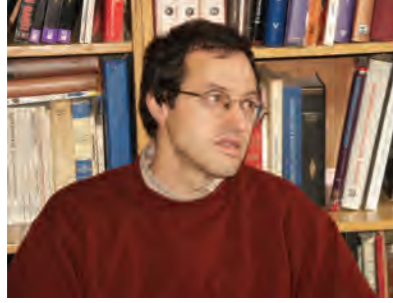
Gazeteci-Yazar Tanıl Bora.

bir arada yaşam geleneği tükettiğimizdir, birlikte yaşam geleceğimiz ise üreteceğimizdir.