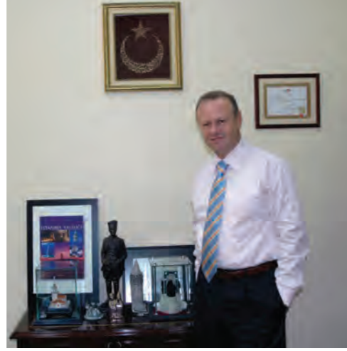
İstanbul Vali Yardımcısı Cumhuriyet Güven Taşbaşı.

konseylere, "dünya kültür başkenti" seçilmenin İstanbul halkına kültürel, ekonomik ve sosyal olarak neler katacağı, kentte nasıl bir değişim yaşanacağı gibi detaylarla ilgilendiğinden, biz de bunlara yönelik projeler hazırladık.