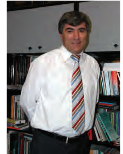
Gazeteci Hrant Dink