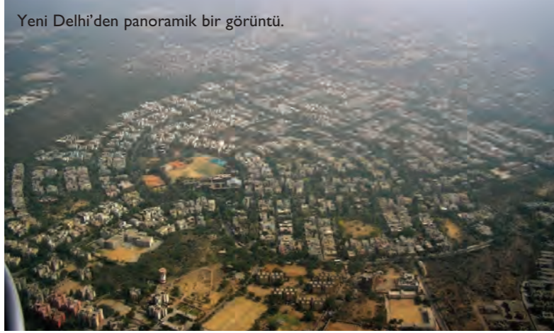
Yeni Delhi'den panoramik bir görüntü.