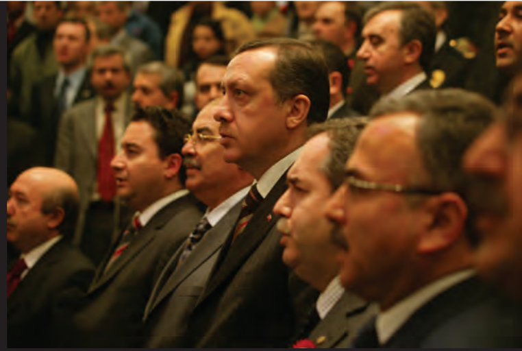
Hazırlayan: Ali Boratav

18 Eylül-06 Ekim 2006 tarihleri arasında Birinci Mülkiyeliler Trend Araştırmamız gerçekleştirildi. Mülkiyeliler'e iktidarda 4'üncü yılını tamamlayan AKP hükümeti ve yöneticileri hakkında ne düşündüklerini sorduk. 320 Mülkiyeli'den, kimilerine şaşırtıcı, kimilerine olağan gelebilecek net yanıtlar geldi. Fazla söze gerek yok, işte Konsensus Araştırma Şirketi ile işbirliği içinde gerçekleştirdiğimiz anketin sonuçları!