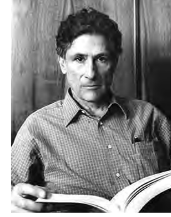
Edward W. Said; 1935-2003.

tırmalı edebiyat çalışmaları, daha çok kültürler arası etkileşim üzerinde yoğunlaşır. Böyle bir bakış açısının gereği olarak Fransız ekolü, karşılaştırmalı edebiyat çalışmalarında yalnız edebiyat metinlerinden değil, felsefe, sosyoloji, psikoloji ve siyaset bilimi gibi farklı disiplinlerin bulgularından da yararlanmayı öngörür. Rene Wellek başta olmak üzere, Amerikan ekolüne mensup bilim adamlarınca sert eleştirilere uğrasa da, Fransız ekolünün kültürler arası ve imgebilimsel yaklaşımı bugün de geçerliliğini koruyor ve "karşılaştırmalı edebiyat"ın içinde, "İmgebilim"in önemi giderek artıyor. Bugün artık İmgebilim, edebiyatın yanı sıra sosyoloji, etnoloji, tarih ve antropoloji gibi bilim dallarıyla da yakından ilişkili "disiplinler arası bir inceleme alanı"na dönüşmüştür denilebilir.