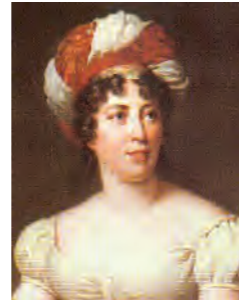
Madame de Stael; 1766-1817.

İmgebilim (İmagoloji)... İzlekbilim, karşılaştırmalı bir yöntemle farklı ulusların edebiyatlarında işlenen ortak temaları ve motifleri ortaya çıkarmaya çalışan bir uğraştır. Önceleri karşılaştırmalı edebiyat çalışmaları içinde ağırlıklı bir yere sahipken, sonradan bu ağırlığını yitirmiştir. İmgebilim'in inceleme alanlarından biri ise imgelerin oluşmasına yol açan kültürler arası bağlantıların ortaya çıkarılmasıdır. Bir ülke edebiyatı, farklı kültürlere sahip insanlar tarafından nasıl alınır? Bir ülke edebiyatına farklı kültürler nasıl bir imgeyle yansır? İmgebilim, bu soruları soruyor ve yanıtlarını bulmaya çalışıyor...