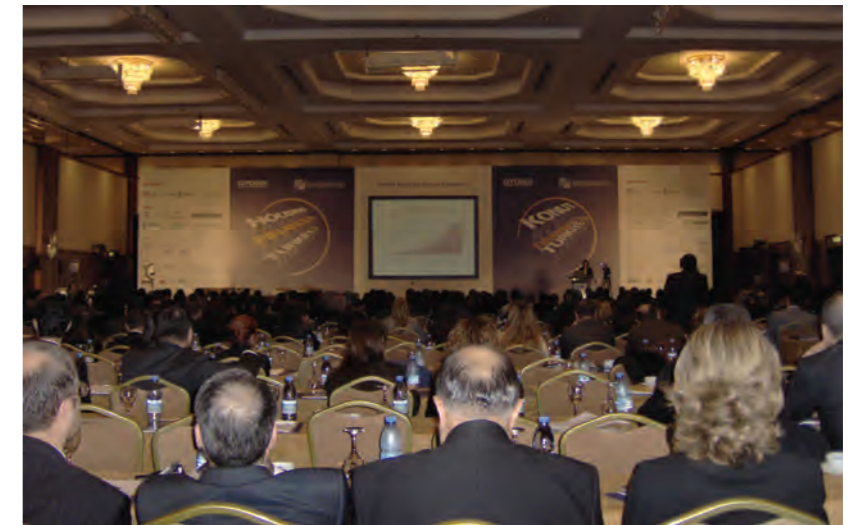
"Konut Finansmanı ve Türkiye Konferansı", 2007 açısından umut dolu geçti.

Uzmanların tahminlerine göre 2007'de kullanılacak olan konut kredileri bakiyesi 27-30 milyar YTL., faiz oranı ise yüzde 15-16 olacak.