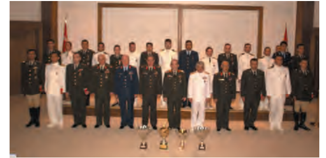
En büyük tepki askerden gelendir: % 42,7.

Üniformalı-üniformasız farkı ortaya çıktı. "Sivil kamu görevlilerinin itiraz etme hakkı: % 86". "Üniformalı kamu görevlilerinin itiraz hakkı: % 61".