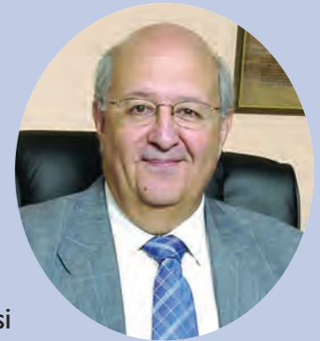
Yazı: Prof. Ersin Kalaycıoğlu*

Temsili demokrasilerde, halkın sürekli olarak siyasetle uğraşması söz konusu değildir. Ancak, onun yokluğunda, onun adına otoriteye ilişkin kararları almak meşru yetkisini kullanmak üzere seçilmiş olan temsilciler, yönetim faaliyetinde bulunurlar. Bu temsilcilerin seçiminin hakça ve yasal olması (due process) esastır. Temsilciler halka karşı siyaseten sorumludurlar ve ona hesap vermekle yükümlülüğündedirler. Gerek temsilcilerin belirlenmesi, gerek halka hesap vermelerini sağlamak için seçim kurumu son derecede elverişli bir yapı oluşturur. Seçimler temsilcilerin hakça ve yasal olarak belirlendiklerini tescil eden, başarısız görülen temsilcilerin de görevden uzaklaştırılmalarını sağlayan bir düzenlemedir. Seçimler herhangi bir baskı ve gözetim altında yapılmadığı ve her temsilci adayı serbestçe ve korkusuzca görüş, fikir ve ideallerini açıklayabildiği sürece serbest ve hakça yapılmış olarak kabul görürler. Serbestçe ve hakça yapıldığı sürece seçimlerin meşru olduğu ve temsili demokrasinin gerçekleştirilmesi için gerekli ilk adımın atıldığı kabul edilir.