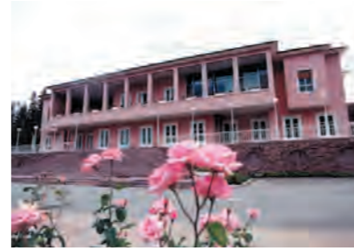
Çankaya yeni bir siyasi kriz nedeni olabilir: % 68,9.