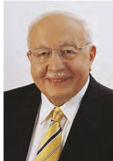
MGK'nın 28 Şubat kararlarının ardından, Başbakan Necmettin Erbakan, başbakanlık görevini hükümet ortağı DYP genel başkanı Tansu Çiller'e vermek amacıyla 18 Haziran 1997'de istifasını Cumhurbaşkanı Süleyman Demirel'e sunmuştu.

yor ve Türkiye'de gerçek demokrasi ancak bu soruya yanıt verecek toplumsal güçlerin ağırlığını hissettirmesi ile kurulacaktır.