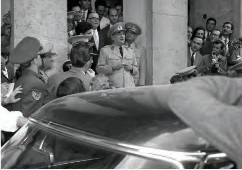
27 Mayıs 1960 darbesi ile Milli Birlik Komitesi'nin başına getirilen Orgeneral Cemal Gürsel, bir açıklama yaparken...

niden "irticaya karşı vesayet politikası"na kavuştu. İslami kanattaki meaculpa ve AKP çerçevesinde yeniden yapılanma kâr etmedi. Takiyye ihtimalleri kuvvetliydi; teyakkuzu elden bırakmamak gerekiyordu. İşte önümüzdeki Çankaya seçimlerine bu koşullarda giriyoruz. Erdoğan Çankaya'ya çıkacak mı, çıkmayacak mı? Çıkabilir mi, çıkamaz mı? Sonunda türban Çankaya'ya girecek mi, giremeyecek mi? Yanıt bekleyen ve kriz potansiyeli taşıyan temel soru bu.