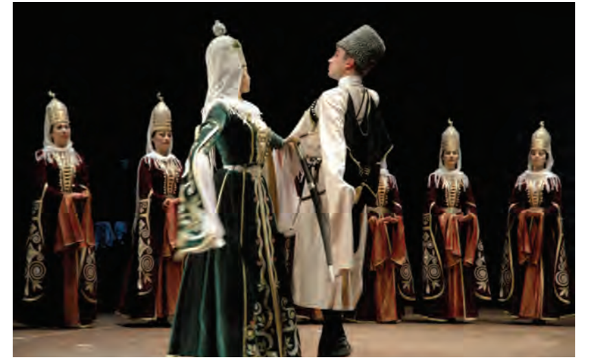
Türkiye'nin toplumla en kaynaşmış ve uyumlu etnik azınlığı sayılan Çerkezler son zamanlarda Türkiye'den anadillerinde eğitim görme hakkını talep ediyorlar.