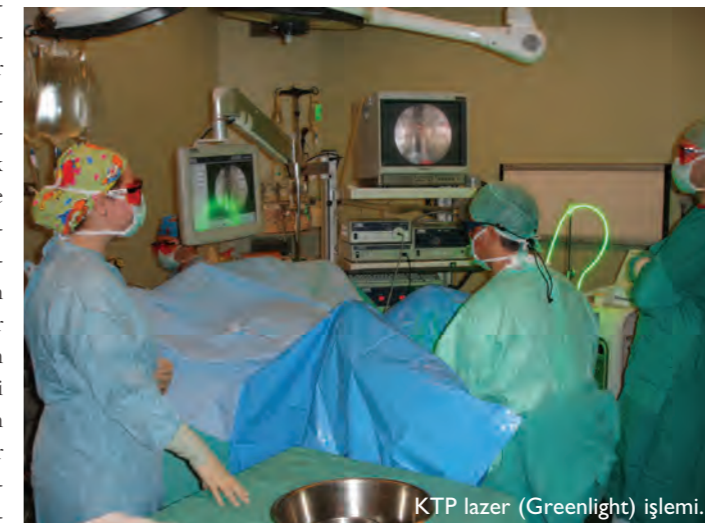
KTP lazer (Greenlight) işlemi.

H erman Hesse “Hiçbir şey koşulsuz olmaz; öyleyse hiçbir şey de bedelsiz değildir” der. Ergenlik döneminden itibaren sperm için gerekli koşulların oluşmasını sağlayan prostatın da ödeteceği bir bedeli vardır. Sperm kalitesine yardımcı olan bu organ, zaman içinde yaşanan insana kendi varlığını hissettirerek; ben buradayım diyebilmek için hayat kalitesini bozar. Bu ifade ediş şekli, bizlere “alt idrar yolu şikayetleri” olarak yansır. Alt idrar yolu şikayetleri işeme eylemine geçerken duraksama, kesik kesik işeme, işeme eylemi bittikten sonra damlama olması, çatallı işeme, ıkınarak işeme, işeme süresinin uzaması, günlük işeme sıklığının artması, acil işeme ihtiyacı, acil işeme ihtiyacı ile birlikte olan idrar kaçırma, gece işeme ihtiyacı ile uyanma, ağrılı işeme ve idrar kaçırma olarak sıralanabilir. Bu şikayetlere idrar kesesi çıkışında tıkanıklık yapan, benign prostat hiperplazisi, (prostatın iyi huylu büyümesi) idrar kesesi boyun kısmının darlığı, penis içerisindeki idrar kanalında gelişen darlıklar, idrar kesesi sinir ve kas işlevlerinin bozulması, psikojenik işeme bo-