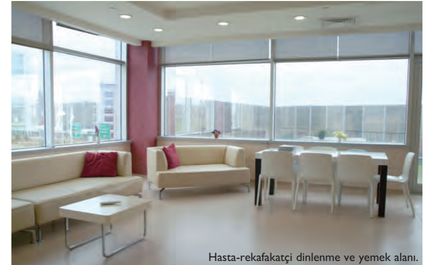
Hasta-rekafakatçi dinlenme ve yemek alanı.