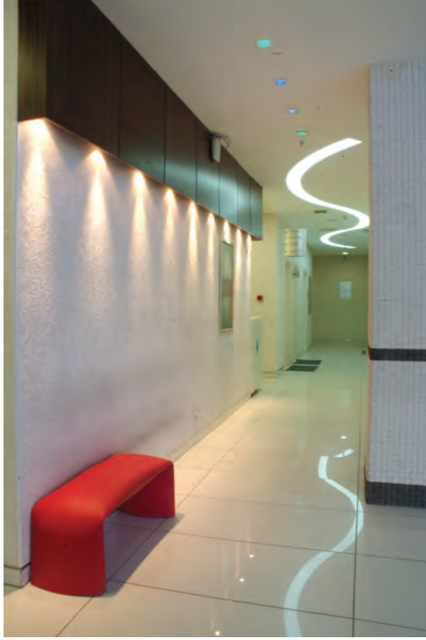
Giriş katta yer alan acile giriş koridoru.