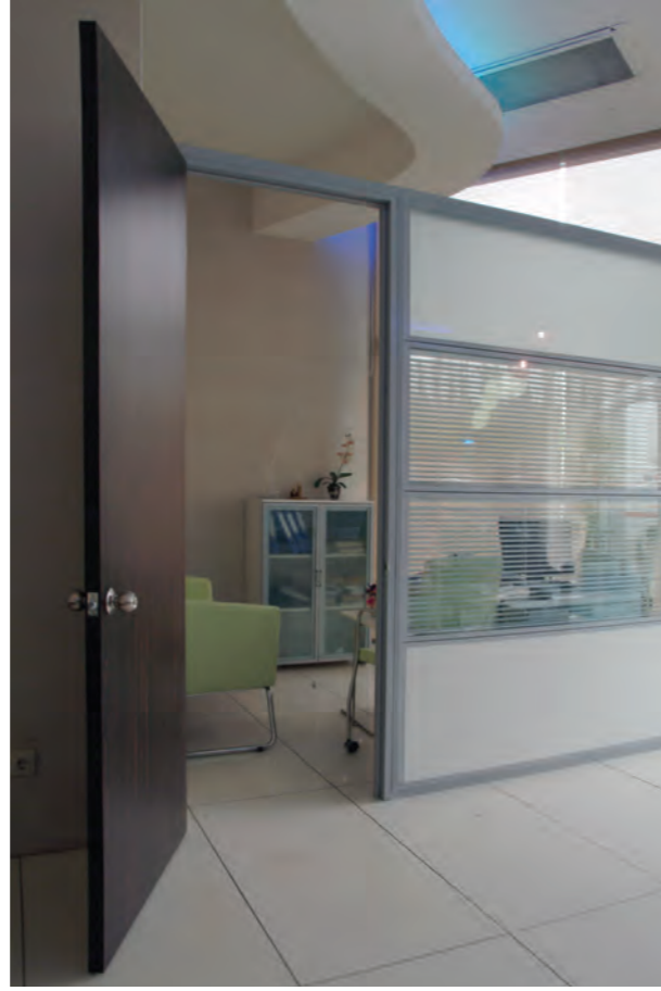
Halkla ilişkiler departmanı. Bu bölümde metal ve ahşap işçiliklerinde hoş bir uyum yakalanmış...